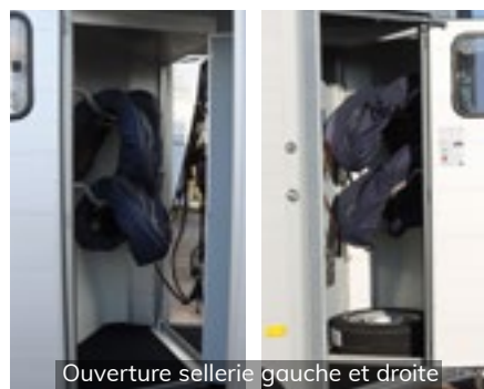
Ouverture sellerie gauche et droite