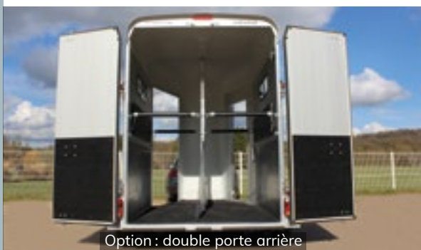
Option : double porte arrière