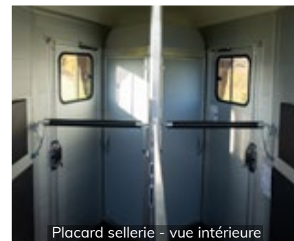
Placard sellerie - vue intérieure